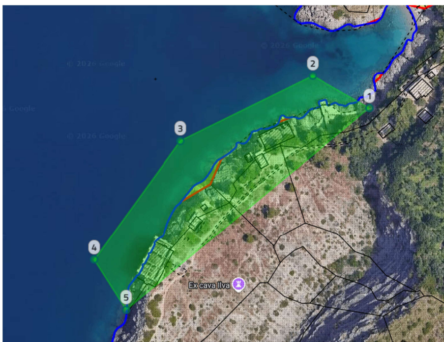
Stralcio sistema cartografico SID