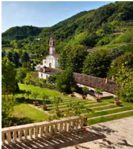
L'escalier sud, dit « des citrons »