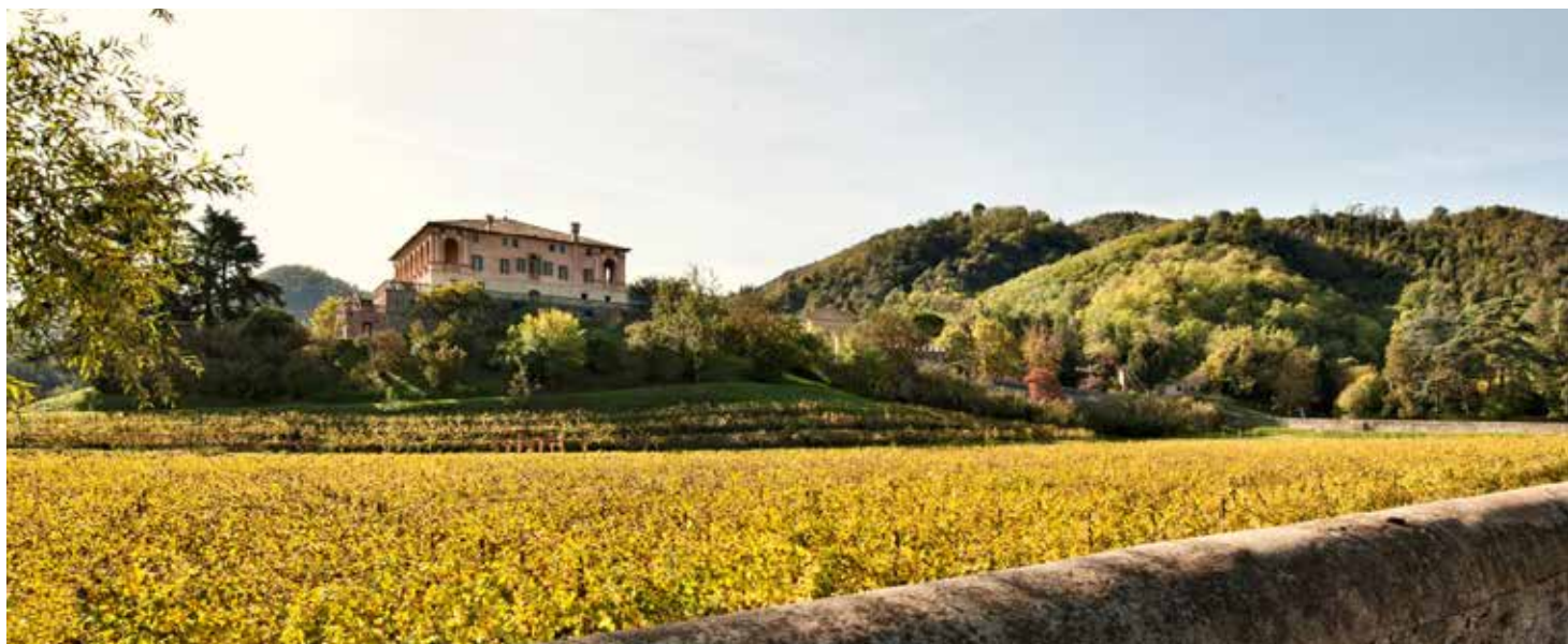
La Villa dei Vescovi vue du Brolo

D u latin brogilus , le mot brolo est utilisé dans tout le nord de l'Italie et en Toscane pour désigner un jardin potager, généralement circonscrit par un mur ou une haie. Aujourd'hui, le terme reste employé dans toute la région de Padoue et indique le verger adjacent à une maison.