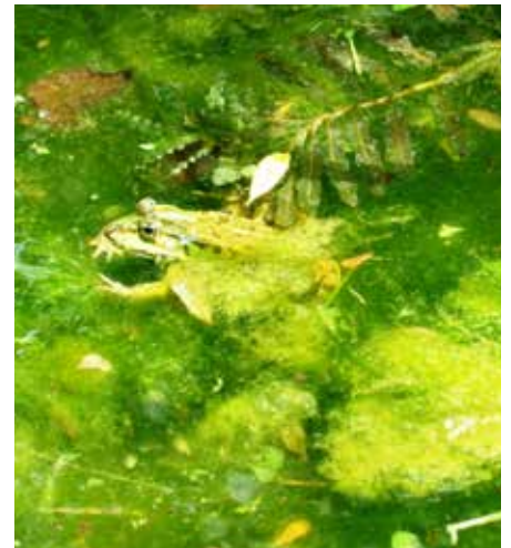
Petit lac « des grenouilles »