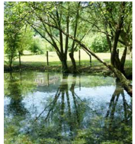
Petit lac « des grenouilles »

La partie nord-est du Brolo est occupée par un petit lac dit « des grenouilles » où nénuphars et autres plantes aquatiques côtoient grenouilles et poissons. On y trouve également la fameuse carpe « koi », variété ornementale originaire d'Asie appartenant à la sous-espèce de la carpe commune, arrivée en Europe à l'époque romaine. Symbole de courage et de persévérance (en vertu de sa capacité à nager à contre-courant) dans la culture japonaise, la carpe koi est très décorative en raison de ses couleurs, qui vont du blanc au noir en passant par le jaune, le bleu, le beige et le rouge.