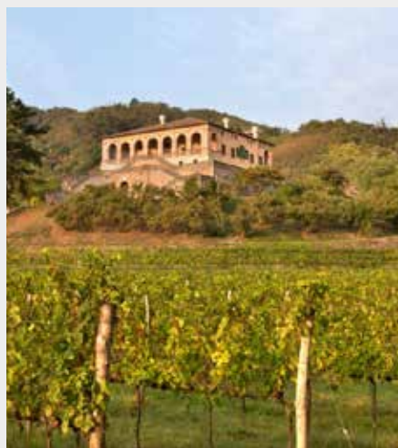
La Villa dei Vescovi vue du Vignoble