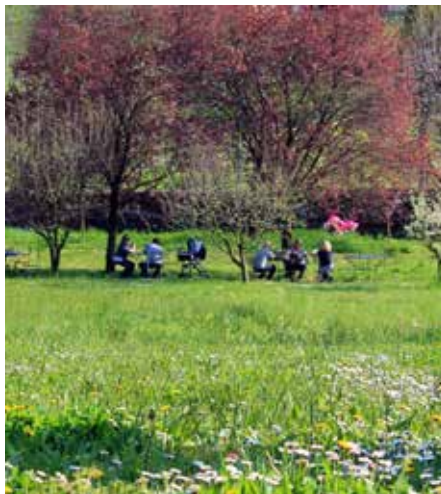
Jardin Potager agricole

Un document du XVII e siècle témoigne de la présence de nombreux arbres fruitiers dans le jardin de la Villa. Aujourd'hui, l'escalier sud donne accès au verger où ont été plantées plusieurs anciennes variétés de pommes, de poires et de prunes. A l'opposé du Brolo, au nord-ouest, 84 cerisiers se dressent dans le Marascheto : ils produisent une variété de cerises rouge écarlate à pulpe tendre au goût acidulé, à partir desquelles on réalise des conserves mais aussi des liqueurs : le marasquin, obtenu par distillation, et un cherry brandy, obtenu par pressage de la pulpe après une brève période de fermentation.