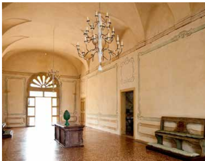
Le Salon tel qu'il se présente aujourd'hui