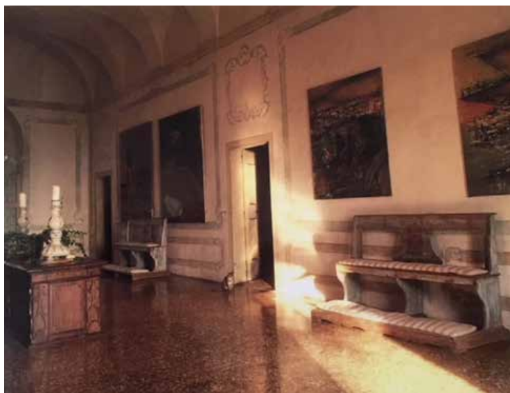
Le Salon à l'époque de la famille Olcese